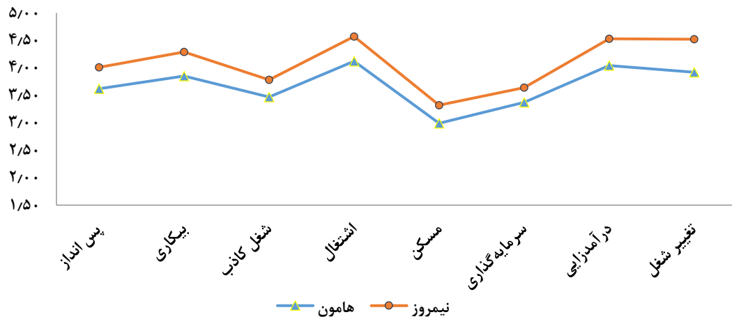
شکل ۲- میانگین شاخص های تأثیرگذار اقتصادی بر مدیریت جامع تالاب هامون